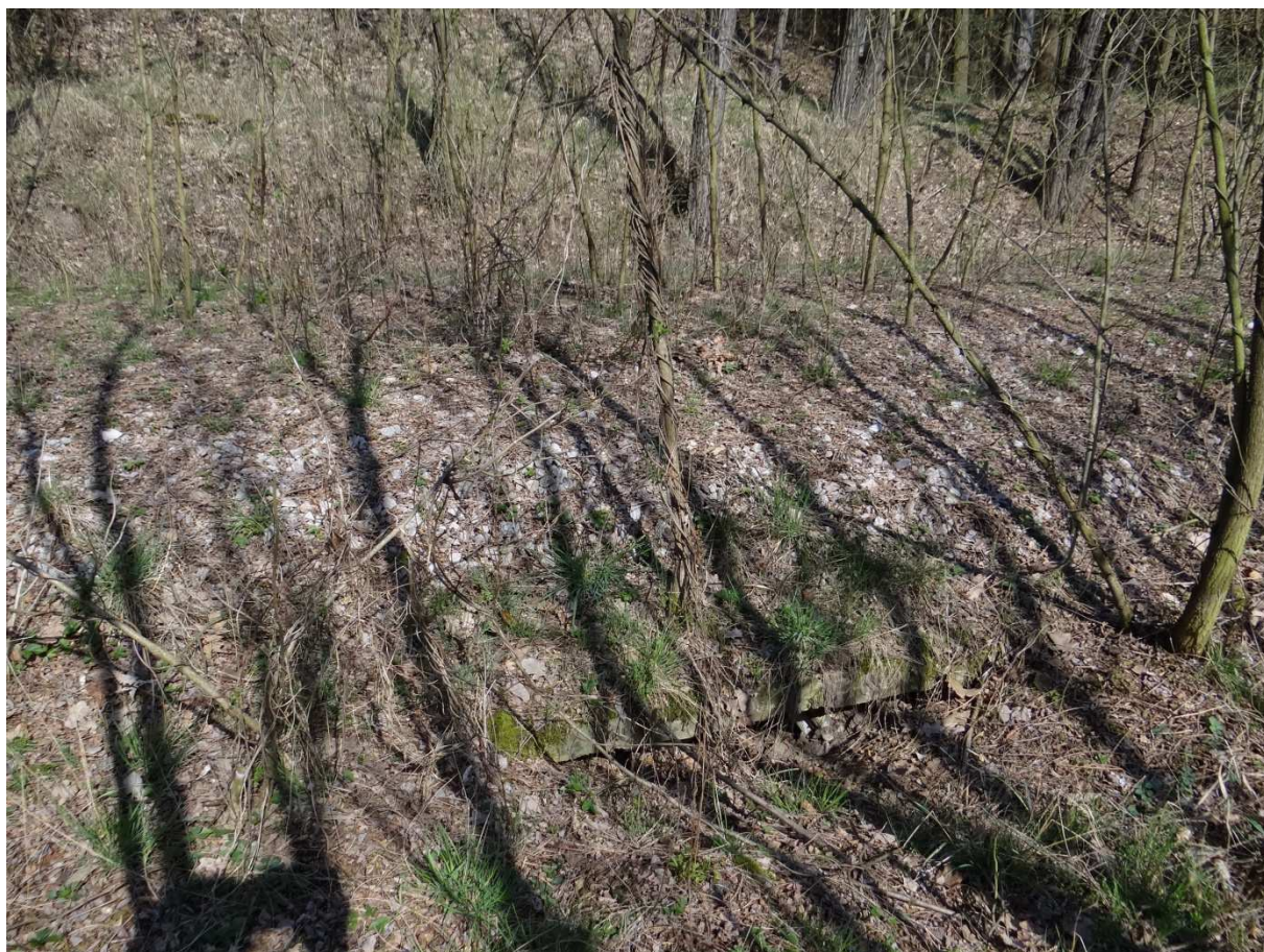
Foto 3 – v místě kudy vlečka vedla je např. tento téměř zasypaný propustek.