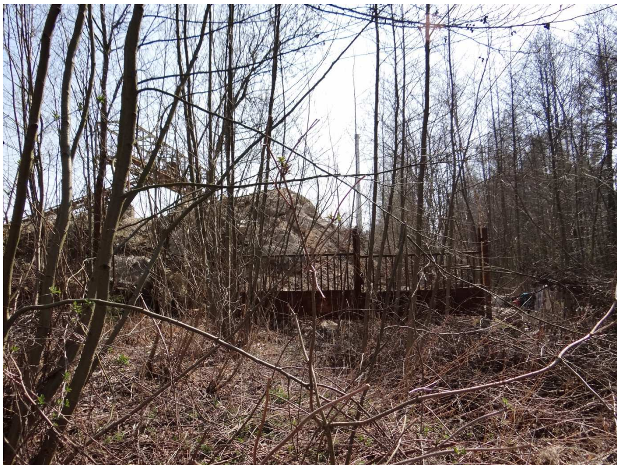
Foto 14 – Konečně poslední vrata – pravděpodobně vstup druhé vlečkové koleje do areálu. Příjezdová kolej vlečky vedla napravo „džunglí“.

Mapování současného stavu vlečky 4260 tímto končí. Je však jisté, že v této lokalitě existovala drážka z pískovny Rašovice, která sloužila k návozu písku (a případně kameniva) do areálu betonárny (pozdější Prefa, nyní Betonika) k dalšímu zpracování. O této drážce se mi nepodařilo získat žádné informace, nicméně těžba písku v katastru obce Rašovice (písník Rašovice) se traduje již od první republiky. Prozkoumaná a zdokumentovaná trasa drážky je v přehledové mapě zobrazena plnou červenou čarou. Možná pokračování směrem k písníku jsou zobrazena přerušovanou červenou čarou. Trasa drážky směrem k vlastnímu místu nakládky bude předmětem dalšího průzkumu.