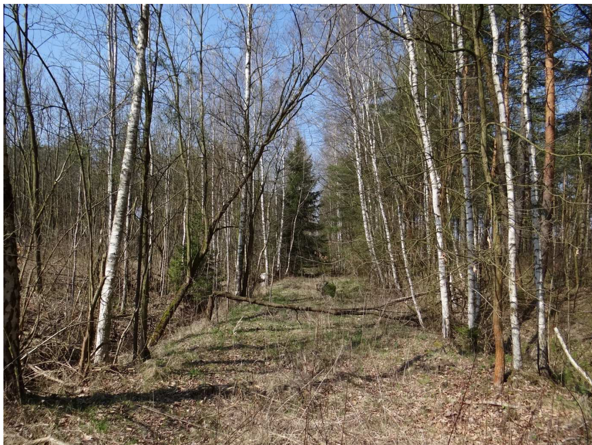
Foto 18 - foceno ze stejného místa jako foto 17, tentokrát však pohled směrem k písňiku Lípa.