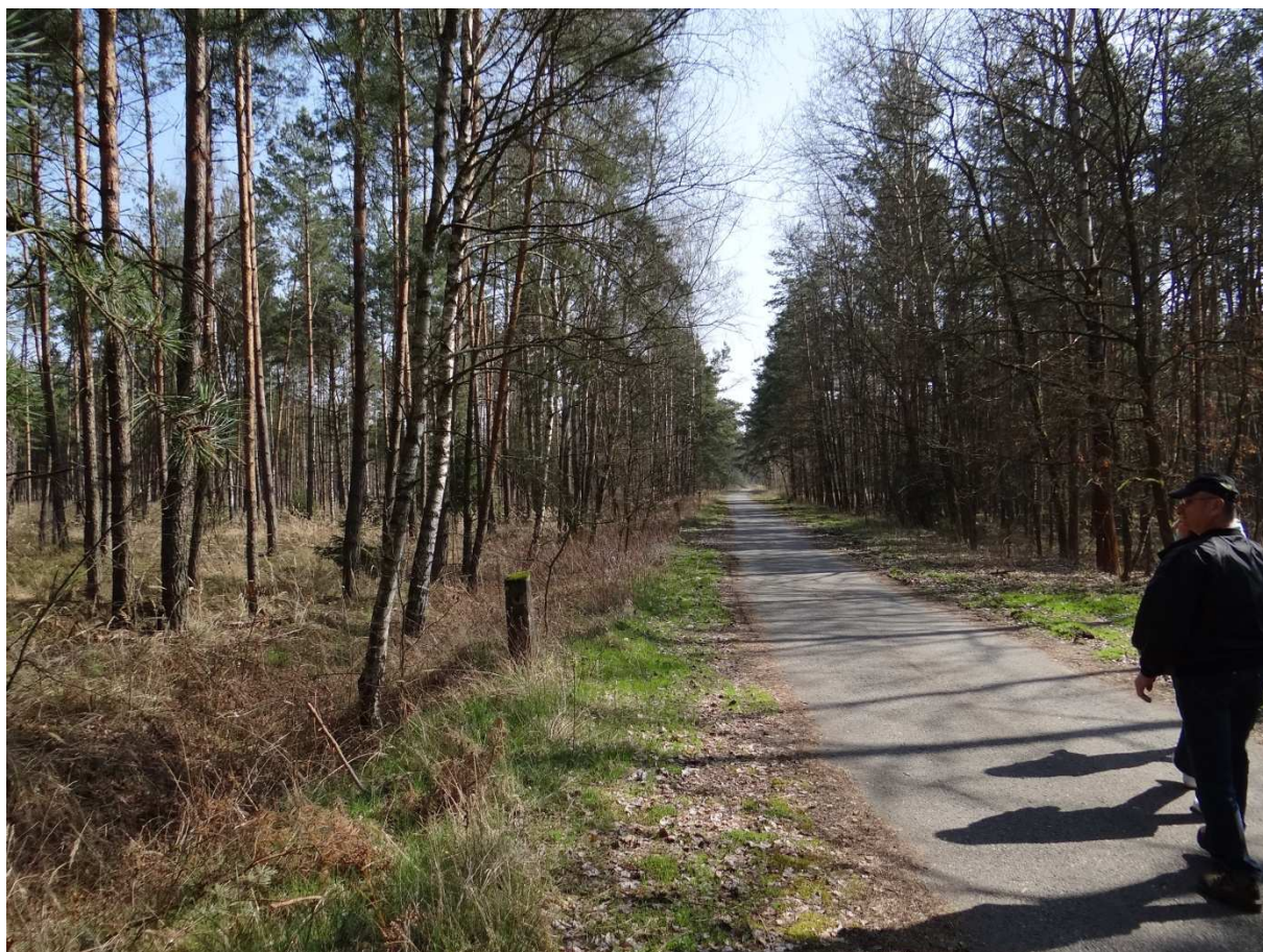
Foto 22 – Asfaltová „zelená“ turistická cesta pokračuje směrem k podniku Betonika. Drážka vedla někudy nalevo. Foceno zády k písňíku Lípa.