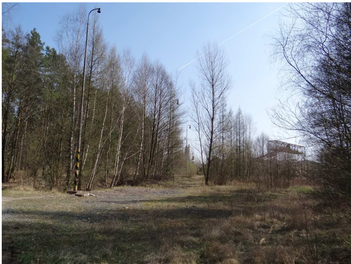
Foto 9 – celkový pohled na místo úvraťové koleje. Foceno čelem k podniku BETONIKA. Za lampami mezi stromy vede cesta, která přetíná místo úvratě a nakonec pokračuje vlevo kolem plotu areálu podniku. Řada lamp jasně ukazuje, kudy vedla úvraťová kolej do areálu (dále označená jako první vlečková kolej). Dle výrobního štítku na jedné z lamp byla tato vyrobena v roce 1984.