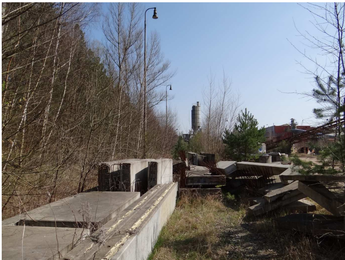
Foto 11 – Řada lamp dává tušit kudy a až kam pokračovala vlečková kolej v areálu podniku.