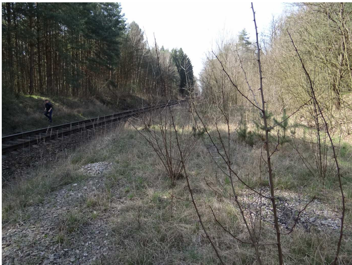
Foto 2 – pohled na těleso vlečky ve směru do areálu dnešního závodu BETONIKA, trať 021 v pohledu směrem Lípa nad Orlicí (Týniště nad Orlicí).