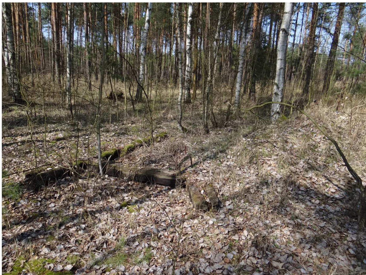
Foto 21 – až do tohoto místa bylo jasné kudy drážka vedla. Její pokračování už není v terénu jasně patrné a bude předmětem dalšího zkoumání.