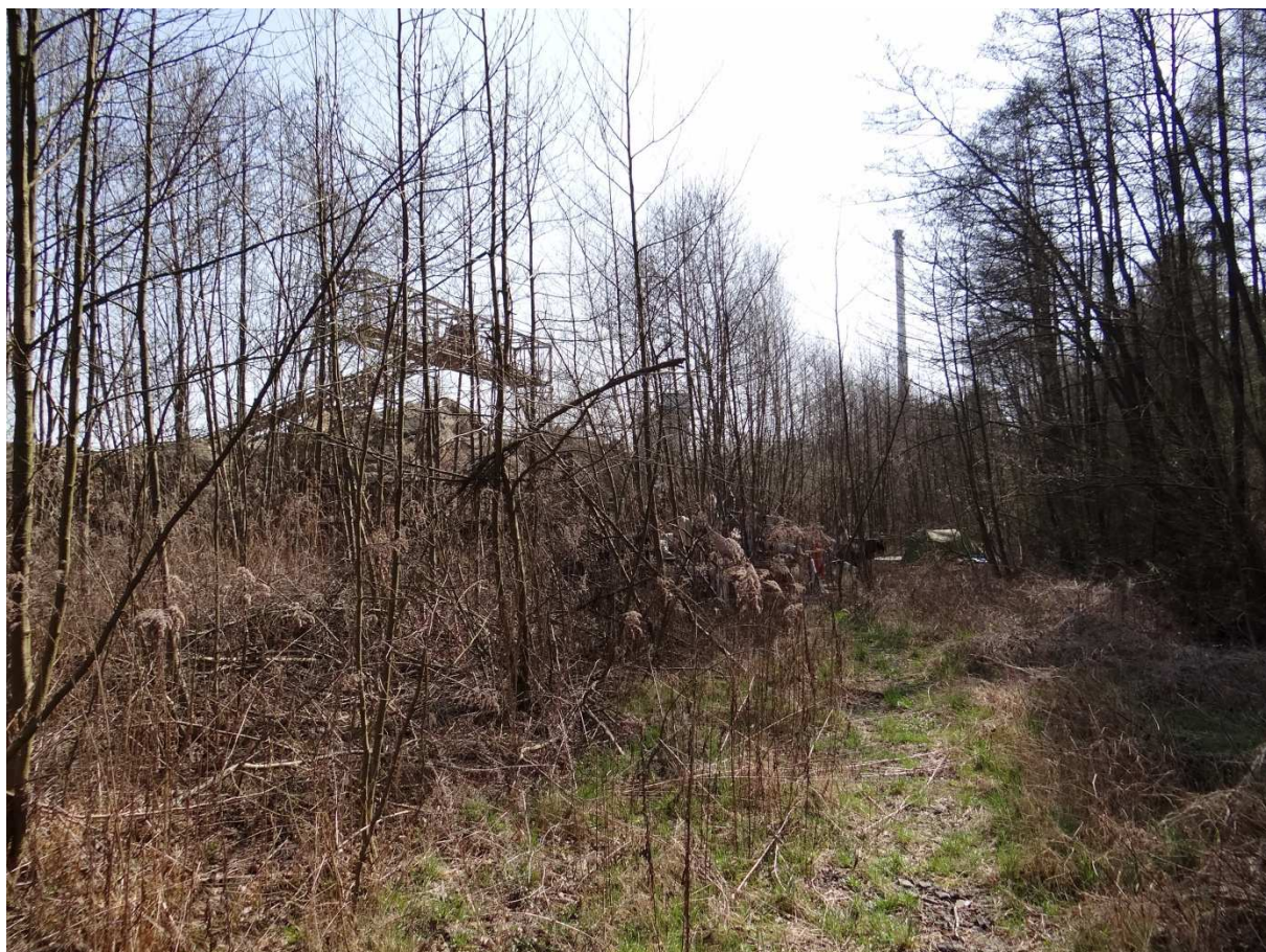
Foto 13 – Místo kudy pravděpodobně vedla druhá vlečková kolej. Na konci jsou vrata (viz foto 14), která však skrz vegetaci nejsou vidět.