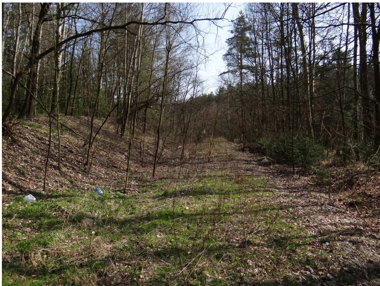
Foto 6 – pohled z místa křížení vlečky s cestou směrem k trati 021.