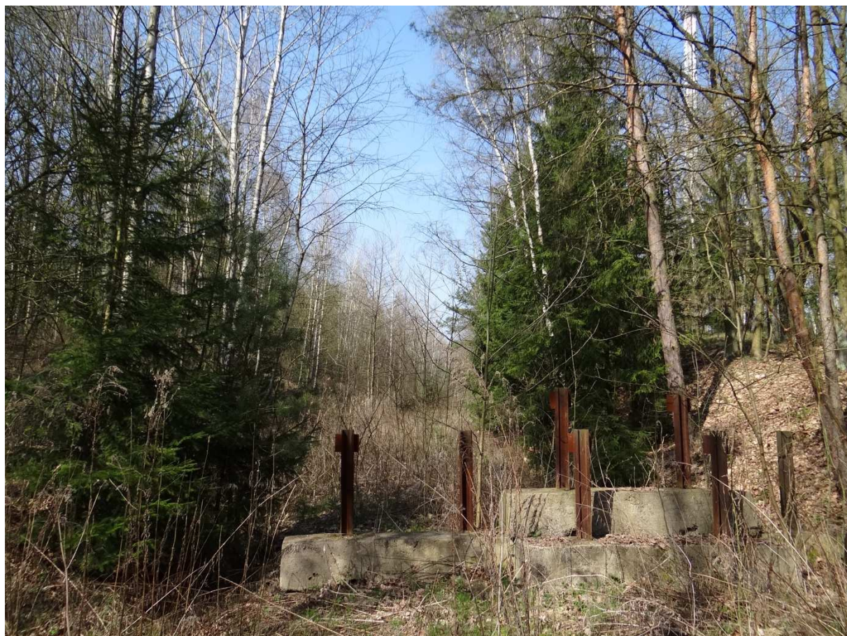
Foto 7 – pohled z místa křížení vlečky s cestou směrem k podniku Betonika – terén už je téměř neprostupný.