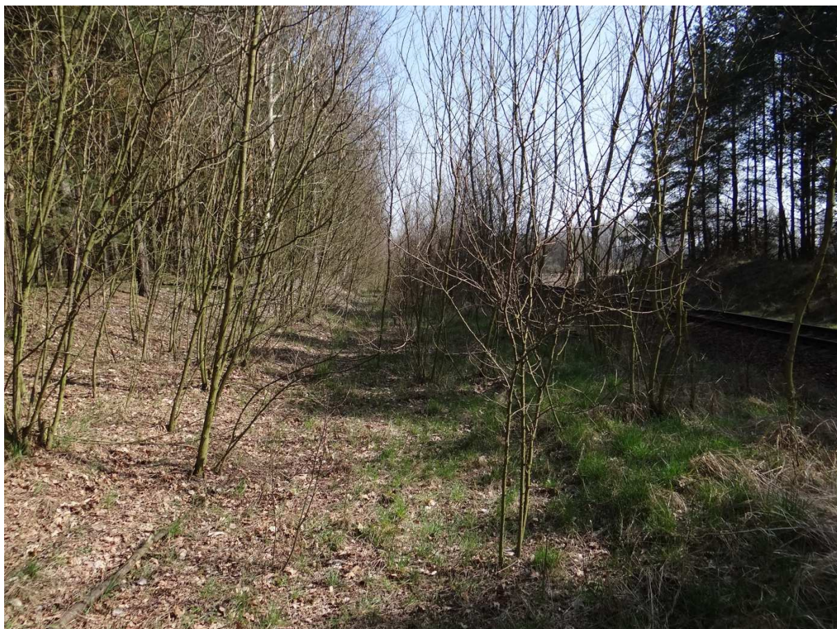
Foto 1 – pohled na těleso vlečky ve směru Čestice (Častolovice), vpravo je trať 021, místo zaústění vlečky na trať nelze dnes dohledat (je patrné pouze z přehledové mapky).