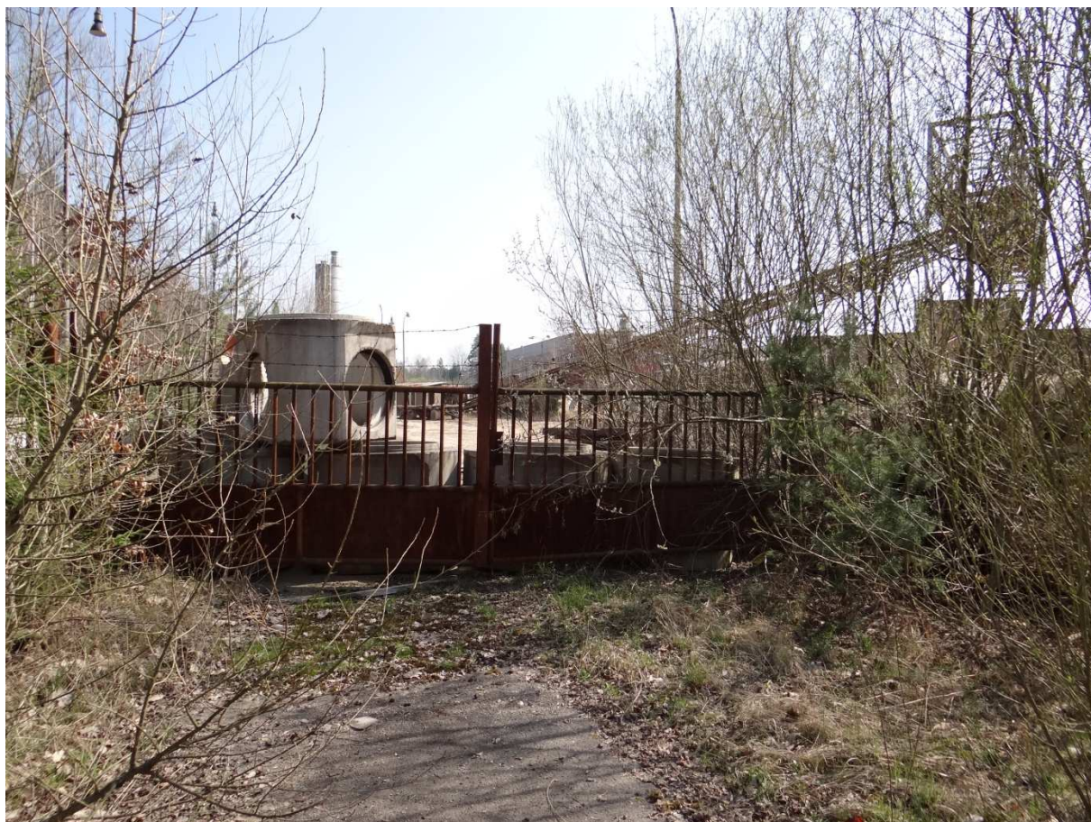
Foto 12 – Další vrata hned vedle vrat první vlečkové koleje (vjezd nákladních aut?).