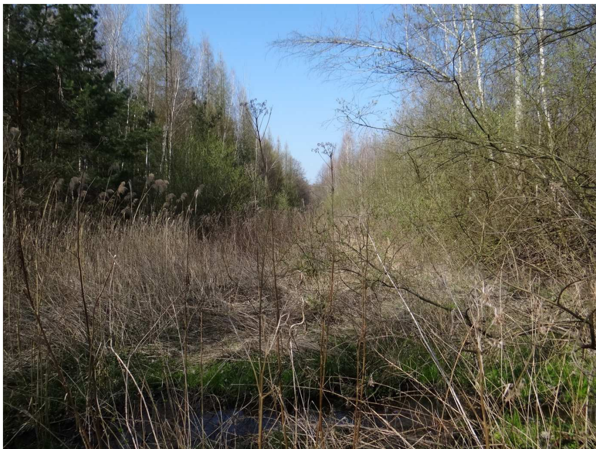
Foto 8 – bližší průzkum tělesa vlečky směrem k podniku Betonika již nebyl možný.

Z přehledové mapky vyplývá, že se do areálu podniku jezdilo úvratí. Úvratě však ležela mimo areál podniku. Na přehledové mapce je toto místo označené oranžovým kruhem – foto 9 až 14.