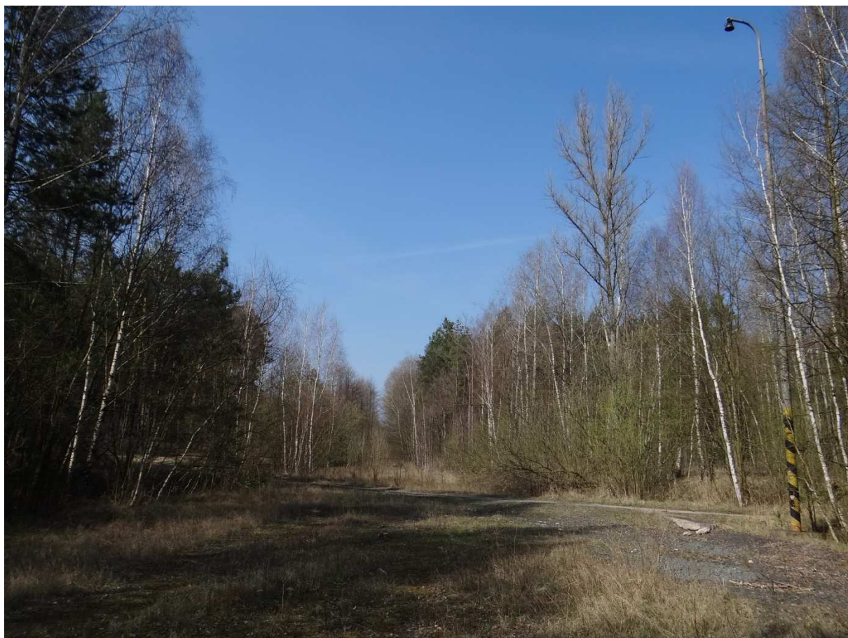
Foto 15 – Celkový pohled na „plácek“ úvratě. Vlevo mezi stromy je cesta, která přetíná vlečku a nakonec pokračuje kolem areálu směrem k silnici na Rašovice (viz také foto 9). Mezera mezi stromy dává tušit směr drážky.