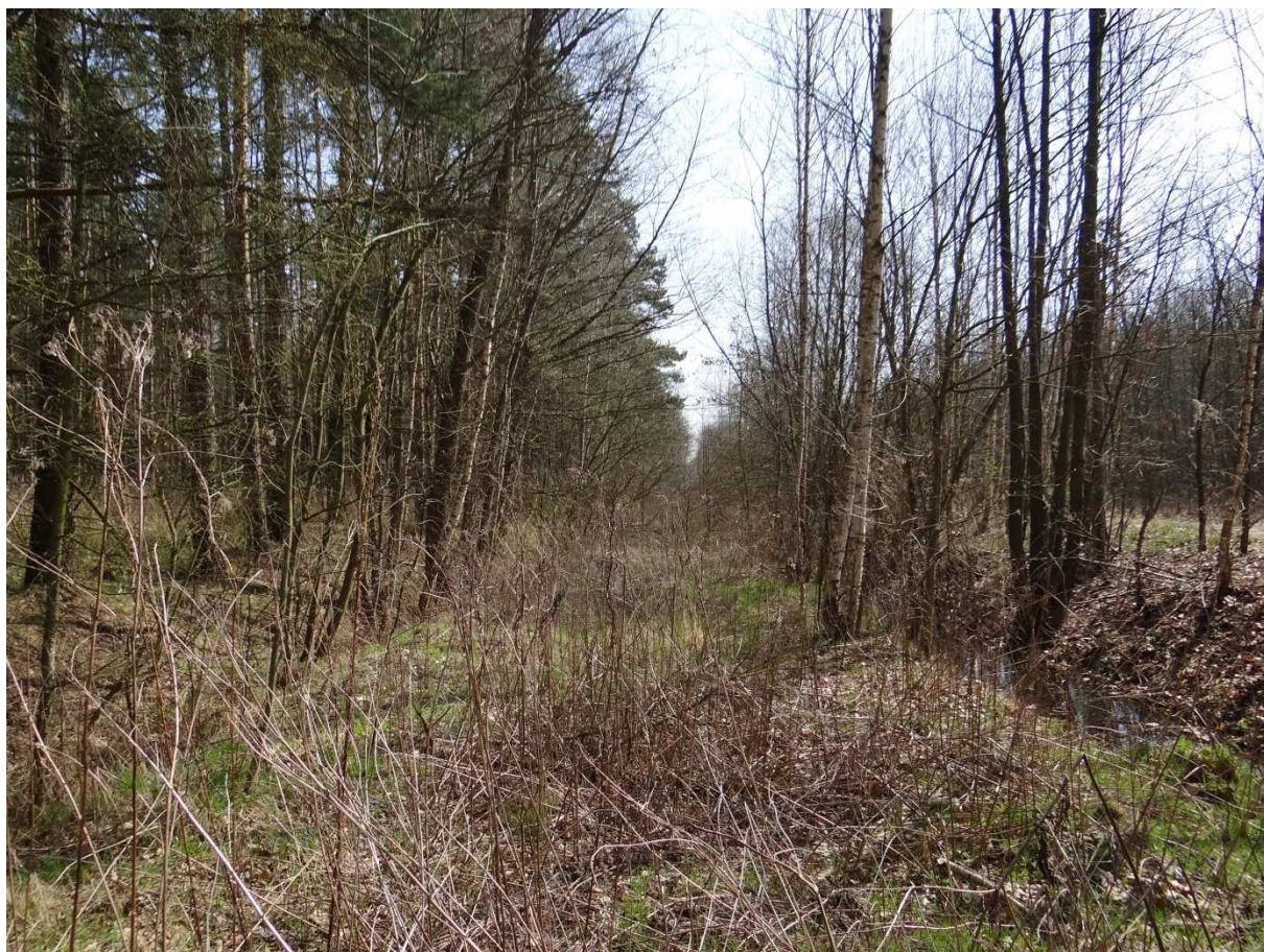
Foto 17 – trasa drážky směrem k podniku Betonika. Zcela vpravo vede již několikrát zmíněná cesta. Foceno z místa, kde „zelená“ turistická cesta přetíná drážku (viz přehledová mapa).