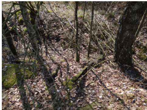
Foto 19 – na tělesu drážky jsou vidět pozůstatky práčců (nalezený hřeb mám ve své sbírce 😊).