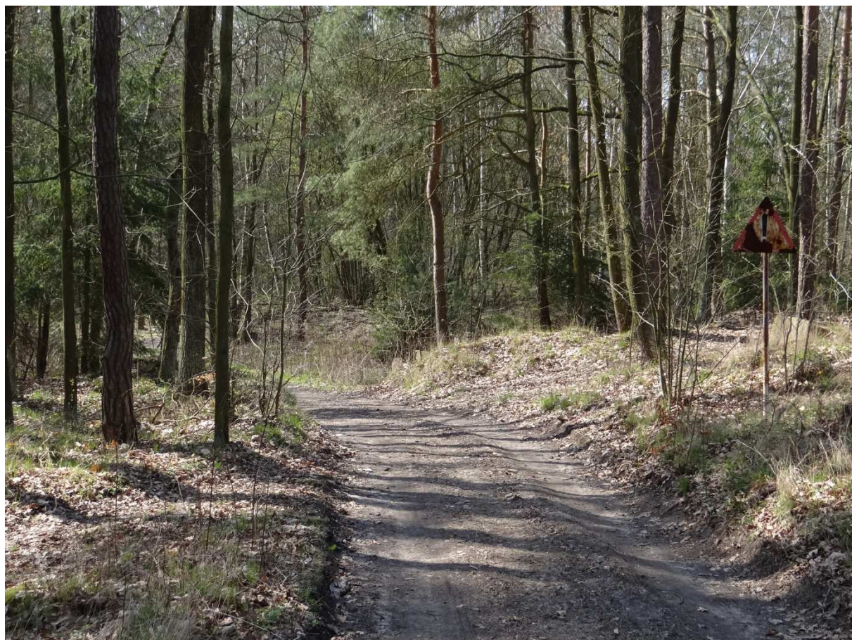
Foto 4 – místo kde vlečka křížuje cestu (označeno dopravní značkou Jiné nebezpečí) je na přehledové mapce označené modrým kroužkem.