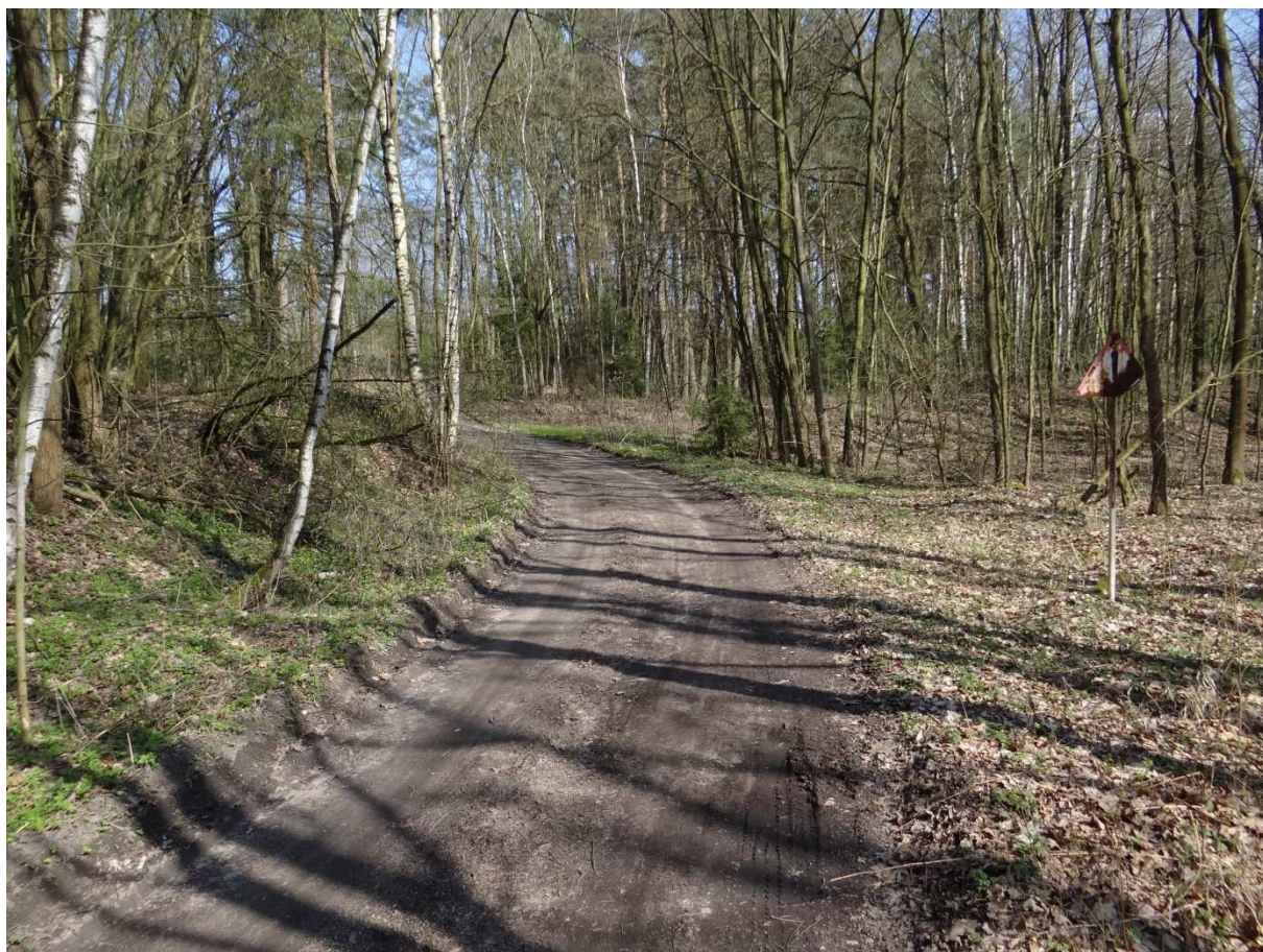
Foto 5 – stejné místo jako na předchozím obrázku, tentokrátě foceno z druhé strany.